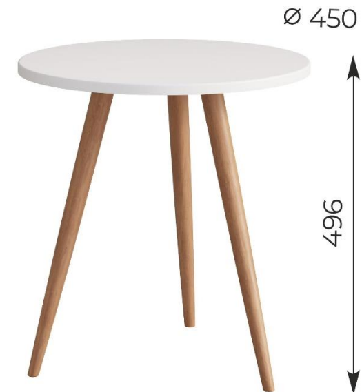
Стол журнальный «СФЕРА»